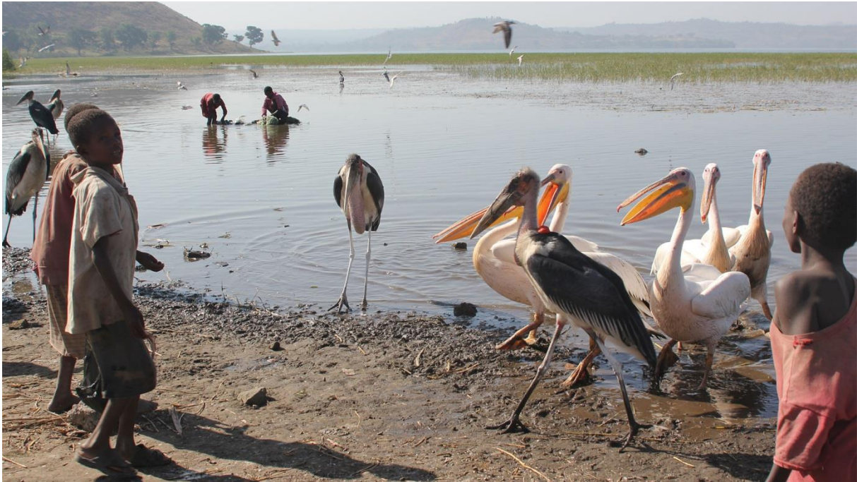
Awassa Fish Market

Vi såg ungefär samma arter som dagen innan. Vi gjorde också ett kort stopp vid den berömda "Fish market", vilket var en intressant fågelupplevelse, men även kul att se hur vissa fiskare rensade fångsten genom att använda munnen! Hade vi inte redan upplevt närheten till Marabou Stork och Great White Pelican vid Lake Ziwai hade naturligtvis upplevelsen av Awassa Fish Market varit ännu starkare, men den var fortfarande imponerande.