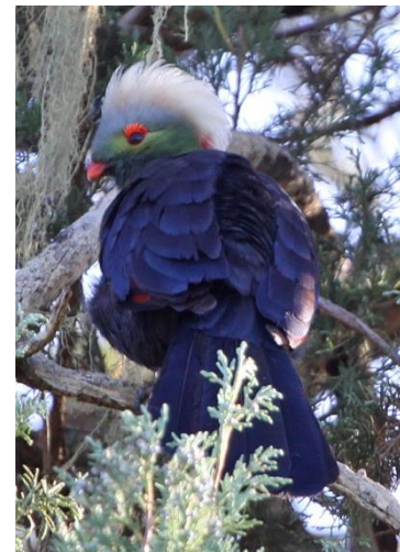
Prince Ruspoli's Turaco