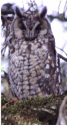
African Long-eared Owl

Vi hann inte pusta många minuter innan den lokale fågelguiden Abdullah kom för att ta oss med på en "game walk" i närområdet. Vi blev påvisade många ståtliga Gedemsa (Mountain Nyala), några Ethiopian Highlands (Menelik's) Bushbuck och även gott om Common Warthog . Djuren var både fina och extremt nära, men det var nog den på dagkvist fint sittande African Long-eared Owl som vi blev gladast för.